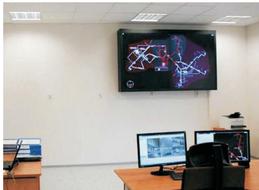
Zmodernizowana podstacja "Szczerbowskiego" (MPK Lublin)